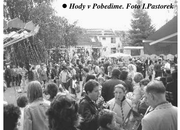
● Hody v Pobedime.

o všetko sa nám vynorí v pamäti pri slovu hody. Deti si predstavia kolotoč, gazdinky upratovanie a chystanie koláčikov, muži si možno spomenú na futbal. Toto všetko patrí k hodom, no je to len obal. Vieme, že obaly sú dôležité a neraz rozhodujú, či si výrobok kúpime. Aj hodový obal je dôležitý, ale nie podstatný. Hody sú predovšetkým slávnosťou ou patróna kostola. Spomínam si, ako sme kedysi kupovali horcu v tzv. horách. Bolo to výhodné, lebo nám zostal dobrý pohár. Určite by však nebolo správne, keby sme si zakladali len na obale. Ve podstatná je chuť výrobku a nie obal. Obal len láka k obsahu vo vnútri. Ak je obal na hodoch rozličný radovánky a dobroty, tak si treba uvedomiť, že to za chvíľu pominie. Koláčiky sa zjedia, na zážitky zabudneme. Zostane nám prázdnejšia špajza, pečať a v tom horšom prípade aj hlava. Podstata by však mala pretrvať. Patrón kostola totiž nechodí k nám ako kolotočár, raz za rok. Je s nami stále a prihovára sa za nás. Možno viac v sebe zbere úrodu i v zime, kedy nie sú hody. Na hody vlastne akoby sme chceli Bohu poďakovať za jeho dobrodenia, ktoré nám preuká-