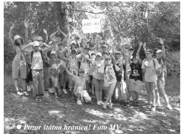
• Pozor štátna hranica!