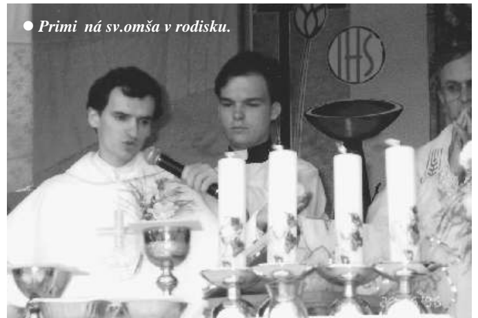
● Primi ná sv.omša v rodisku.

Je to katolícka obec, má krásnu a bohatú históriu. Sú tu vzácní udia, ktorých si vážim. Prednos ou našej farnosti je aj štedros , za ktorú vás ur ite Boh odmie a. K slabším strán-