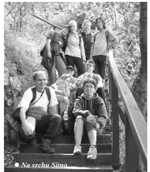
● Na vrchu Šitno

kam pod a môjho poh adu patrí akási nevšímavos . Viackrát sa mi stalo, že udia mi pomohli, ale až vtedy, ke som ich o to poprosil. Hoci sami sa mohli dovŕtiť , že potrebujem pomoc. Ale na vine môže by aj moja tvrdohlavá povaha.