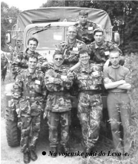
● Na vojenskej púti do Levo e.

S úsmevom rád odpovedám, že moje povolanie na k azský stav za alo 5 rokov pred mojím narodením, kedy mama hovorila, že chce chlap eka a dá ho vyštudova aj za k aza. Narodila sa sestra a ja až o 5 rokov neskôr. Pre k azstvo som sa rozhodol sám. Cítil som vnútorné volanie Boha. Bolo to za socializmu a ke že to nebolo ahké rozhodnutie, jeden rok som strávil v pe ivár ach v Seredi ako robotník. Až potom som sa rozhodol vstúpi do seminára v Bratislave. Tam moje povolanie ešte dozrievalo. Po vysvätení za k aza som nastúpil za kaplána do Banskej Štiavnice. Ke že mám rád hory, tak ma to potešilo. Po roku som musel nastúpi na základnú vojenskú službu. Pol roka som sa