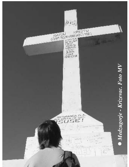
• Medzugarje - Križevac.

Do koledovania sa zapojilo v Pobeďime 8 a v Bašovciach 14 koledníkov, ktorí priniesli radostnú zves v Pobeďime do 27 a v Bašovciach do 25 domov. Týmto spôsobom sa chceme zárove po akova všetkým, ktorí sa do koledovania zapojili, ako aj tým, ktorí nás srde ne prijali do svojich príbytkov a prejaviili solidaritu s núdz-nyimi. Myslím, že tu dvojnásobne platia slová evanjelia: