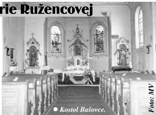
● Kostol Bašovce.

Zaujímavé sú vitráže, maľované figurálne výplne okien svätynne. Podobne ako v pobedímskom kostole sú na nich zobrazení sv. Michal archanjel a sv. Juraj. Spôsob vyhotovenia je však odlišný, rovnako ako i veľkosť okien. Pred oltárom sa nachádza moderný obetný stôl, v ktorom sú umiestnené ostatky svätcov a to sv. Vojtecha a sv. Tomáša Mórusa, uložené v roku 1906. Relikvie pochádzajú z Ostrihomu. Pomerne bohatá je maľba kostola. Dekoratívne prvky sú barokového charakteru rovnako ako orámovania obrazov a náboženských symbolov. Na strope kostola sú tri výjavy. Ide o obraz Emauzský večer,