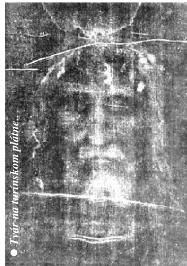
• Tvár na turínskom plátne...

Medzi turistické atrakcie mesta Turína na severe Talianska zaiste patrí aj Dóm sv. Jána, kde je uložené plátno, do ktorého bolo po smrti uložené telo Pána Ježiša. Takýchto obrazov je vo svete viac, ale plátno v Turíne je iné. Pôvodne ho pokladali za pekne nama ovaný obraz. Až pri prvom fotografovaní plátna sa zistilo, že na plátne je vlastne zobrazený negatív. Ale kto mohol nama ova negatív, keď ho vynášli len nedávno? Toto spustilo re az skúmaní pravosti tohto obrazu na plátne. Postupne sa zis ovalo, že ide o udu skrv. Je to odtla ok, lebo tam nie sú ahy štetcom. Zvláštne je, že plátno má krv na oboch stranách, ale obraz je len na jednej. Ide o muža, ktorý bol umu ený presne pod a evanjelií. Prítom je vidie , že nemal prebodnuté dlane, ako sa to všade uvádza, ale ruky boli prebodnuté v zápästí. Vedci potvrdili, že dlane by nevydržali taký tlak tela a lovek by z kríža spadol. Na plátne možno vidie , že palec je skrivený dovnútra. Je to preto, lebo cez zápästie ide nerv a keď sa poruší, spôsobí e palca. Krv stekala v smere gravitácie, a tak lovek v plátne musel visie za ruky. Mal prebodnuté nohy jedným klincom. Sved í nám o tom viac krvi na jednom chodidle. Bol zbí ovaný spredu i zozadu. Mal t ovú korunu a prebodnutý